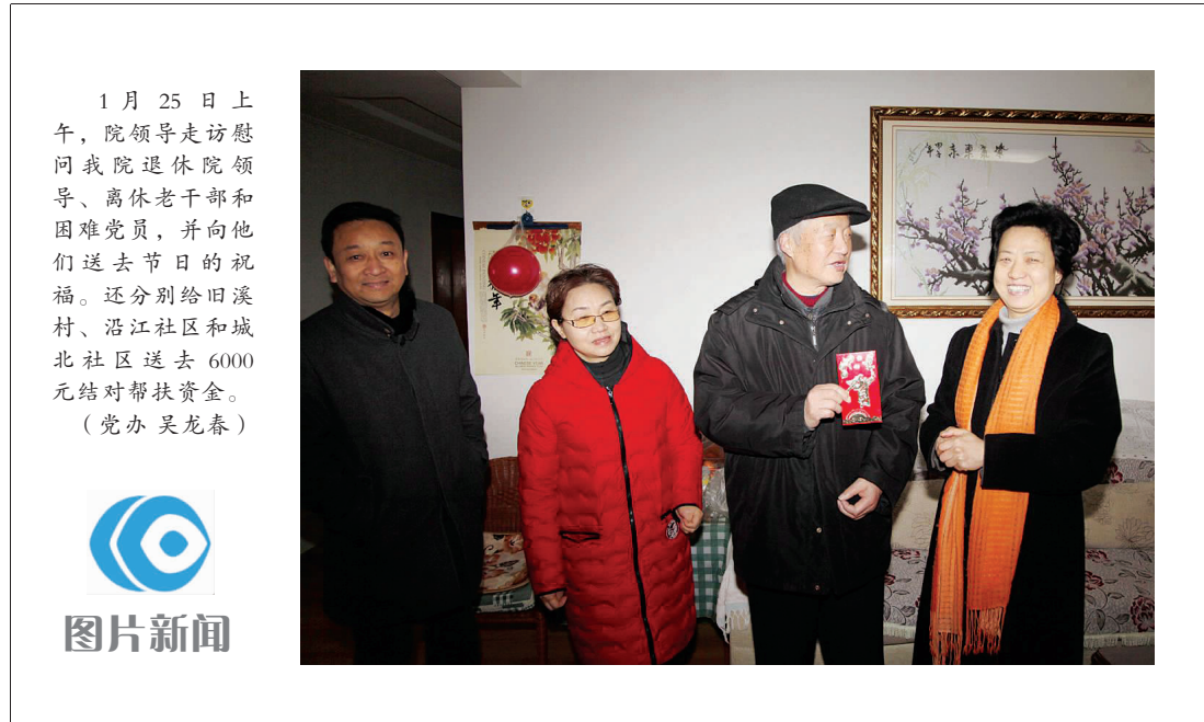
1月25日上午,院领导走访慰问我院退休院领导、离休老干部和困难党员,并向他们送去节日的祝福。还分别给田溪村、沿江社区和城北社区送去6000元结对帮扶资金。(院办 吴龙春)

领导一行参观了医院,并看望了临床护理学院学生和实习生。皖南医学院池州临床护理学院正式挂牌,标志着我院护理工作再上新台阶,科教事业开创了一个新局面,将对提升医院临床教学水平,培养全面发展的优秀护理人才起着重要的推动作用。(院办 刘洋)